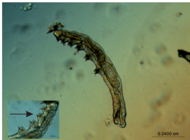
Figura 2. Chaetogaster limnaei , forma ectocomensal obtenida de Physa acuta en la laguna de Los Padres (Buenos Aires, Argentina). *Flecha: Quetas uncinadas.

por setas aciculares uncinadas y por el prostomio poco desarrollado (Di Persia, 1979; Hiltunen y Klemm, 1980; Brinkhurst y Marchese, 1989) (Fig. 2). Se registró sólo la forma ectocomensal del oligoqueto, dado que en todos los casos, los ejemplares se localizaron alrededor de la región de la cabeza y el pie del molusco y por debajo del margen de la valva.